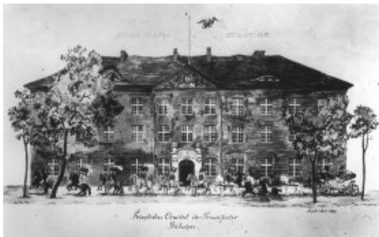
Det gamla universitetet i Frankfurt an der Oder.