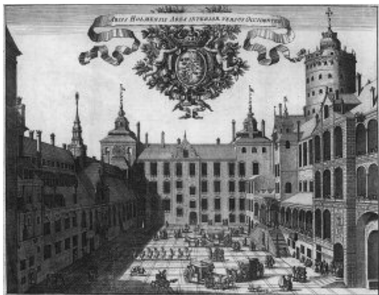
Slottet Tre Kronors borggård. Fyrkanten ligger i hitre vänstra hörnet, balettsalen i fonden till höger. Ur Erik Dahlberghs Suecia Antiqua et Hodierna . Kungl. biblioteket, Stockholm.