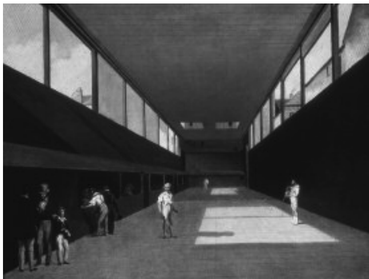
Interiör av bollhuset i Versailles. Målning av L. J. Boilly (1761–1845).