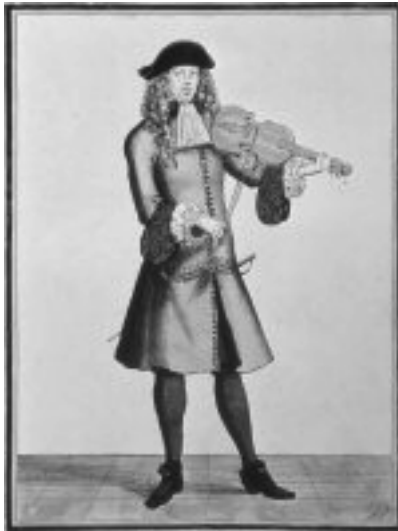
Dansmästare. Gravyr av Nicolas Bonnart (1636–1718).