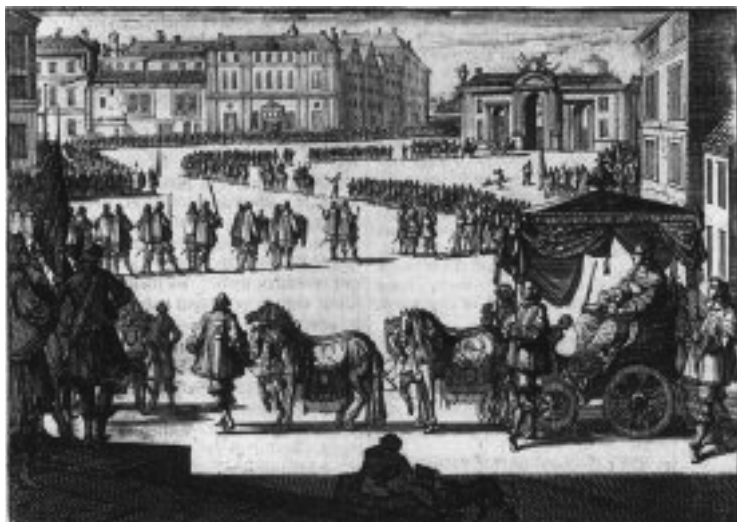
Drottning Kristinas kröningsprocession 1650. Kopparstick efter H. Ludolf: Allgemeine Schaubühne der Welt , Frankfurt am Main 1701.