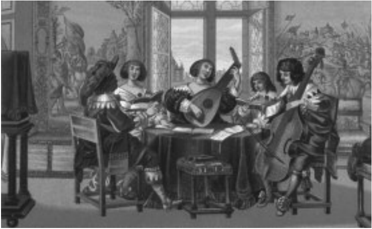
Konsert. Illustration från 1600-talet ur Auguste Racinets Le costume historique , Paris 1888.