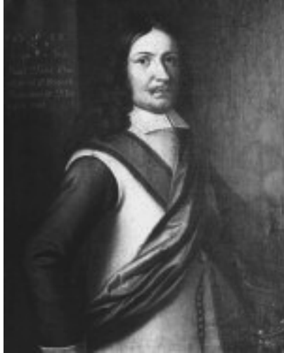
Claes Ekeblad (1625–56). Porträtt av okänd målare. SPA.