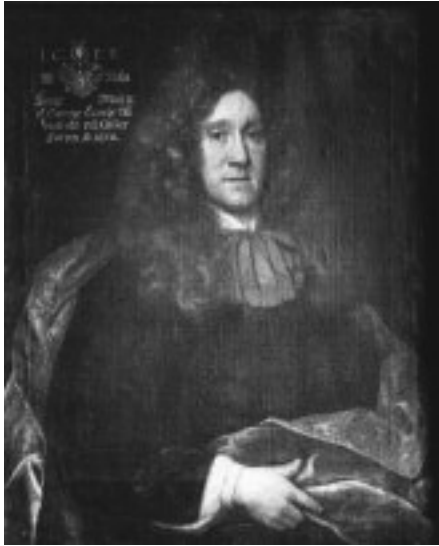
Johan Ekeblad (1629–97). Porträtt 1670 av okänd målare. SPA.