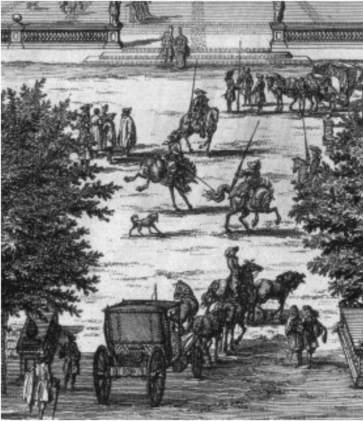
Detalj av tornerspel uppfört vid Salsta slott. Ur Erik Dahlberghs Suecia Antiqua et Hodierna. Gravör: Willem Swidde.