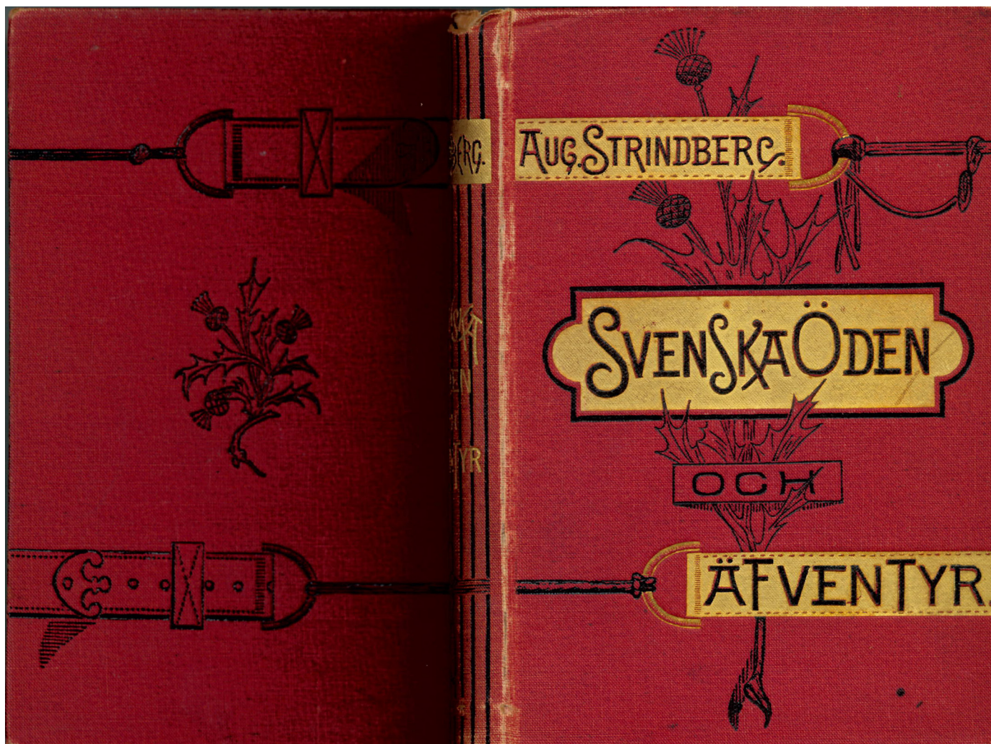
Dok. nr 14:1. Förlagspärm till U 1, band III, av Svenska öden och äventyr . Exemplet tillhör redaktionen för Samlade Verk.